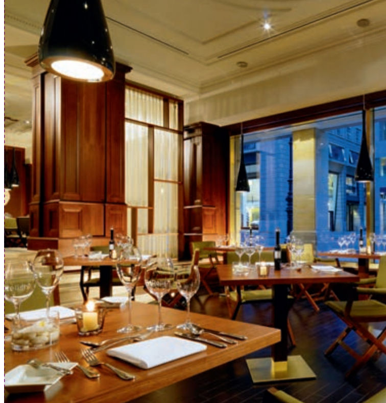
Relish - Restaurant & Bar